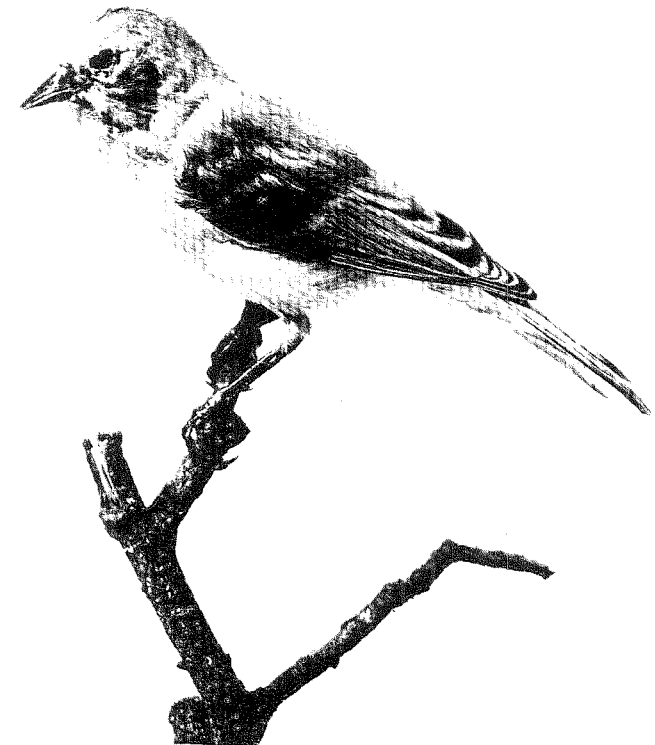
Fig. 2. Ung Pungmeise Remiz pendulinus fundet død ved Tisted, 10.9.71. E. L. Ø. 1972.

T.A.: Bredager 53 st.th., 2650 Hvidovre J.B.B.: Fanøgade 28 st.tv., 2100 Kbh. Ø. B.P.N.: Tuborgvej 181, 2400 Kbh. NV.